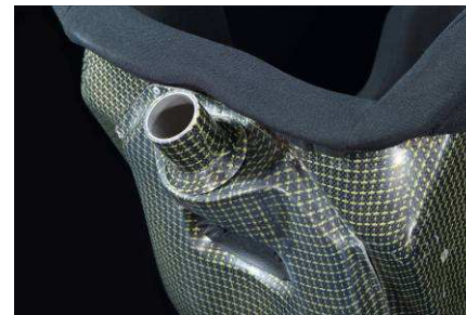
<GT PRO III / NISMO ロゴ入り>