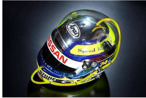
SUPER GT GT500 MOTUL AUTECH GT-R 本山ドライバー使用例 ※写真はイメージです。