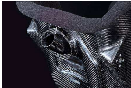
<GT PRO II / NISMO ロゴ入り>