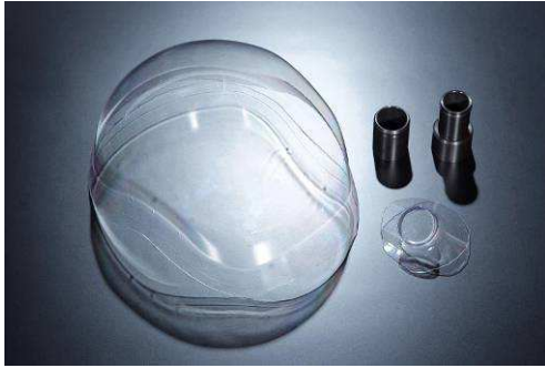
GT クーリングヘルメットカバー + ホース側アダプター

熱を帯びた人体を冷やす上で最も効果的な頭部に効率よくエアコンの冷却風を当てるためのクーリングパーツ。