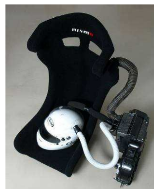
「GTクーリングシステム」使用イメージ

本システムのラインナップは、「GTエアコンシステム」「GTクーリングシート」「GTクーリングヘルメットカバー」となります。ご使用状況に応じてお問い合わせください。